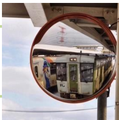
「今泉駅 冬のハーモニー」