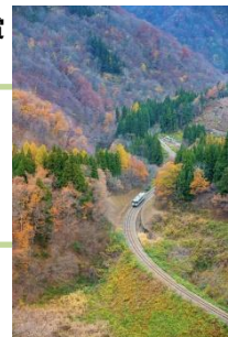
「錦秋の山々を越えて」 ken.f430 様