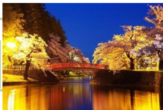
「夜桜と赤い橋」 su_totoro 様