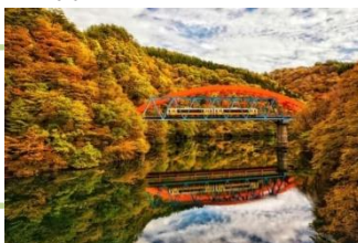
「Upsidedown train」 concon1028 様