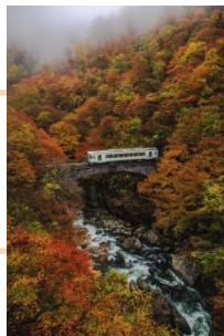
「秋を走る」 taku_0715 様