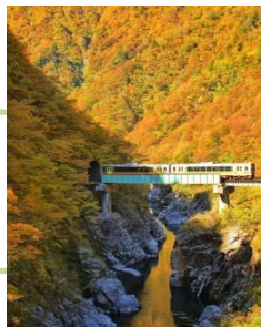
「秋声(しゅうせい)」 kuuto1469 様