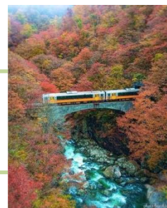
「初めての米坂線」 bucchin.w 様