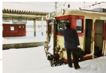
「冬の鉄路に備える」 retro_train_japan 様