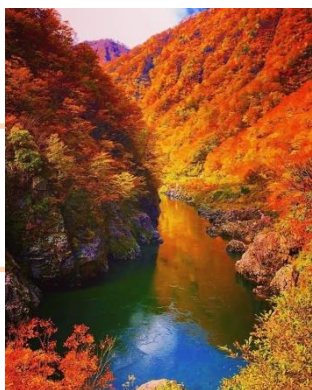
「日本の赤壁」 ymgt_sy.10 様