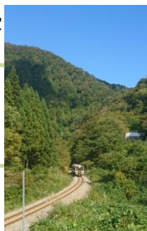
「夏の彩りに包まれて」 aiendo 様