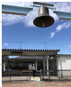
「ダリヤ園帰り電車を待つ母」 tomomifuna 様