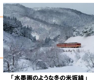
「水墨画のような冬の米坂線」 akaiwa_no_higuma 様