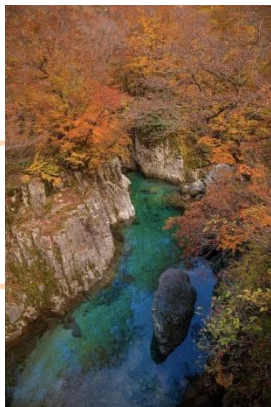
「緑碧玉の流れ」 ken.f430 様